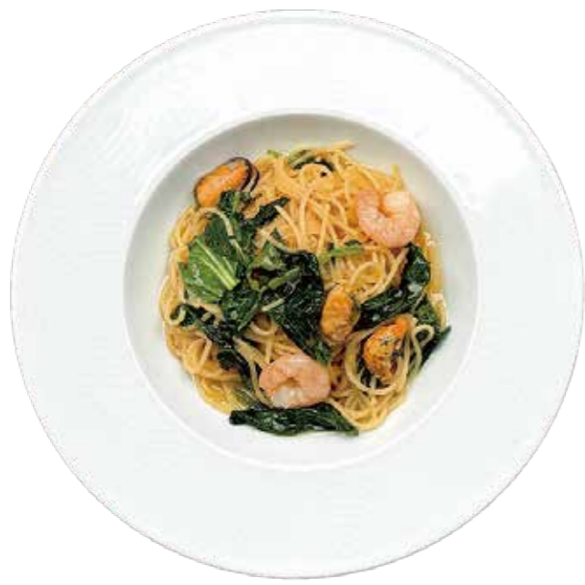
シーフードとほうれん草のペペロンチーノ Seafood and Spinach with Peperoncino Pasta