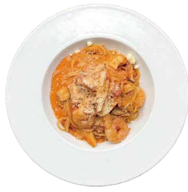
海老ときのこのトマトクリームパスタ Shrimp and Mushrooms with Tomato Cream Pasta

自家製で一から手作りしたナポリタンソースとたっぷり野菜が絡み、くせになるパスタです。