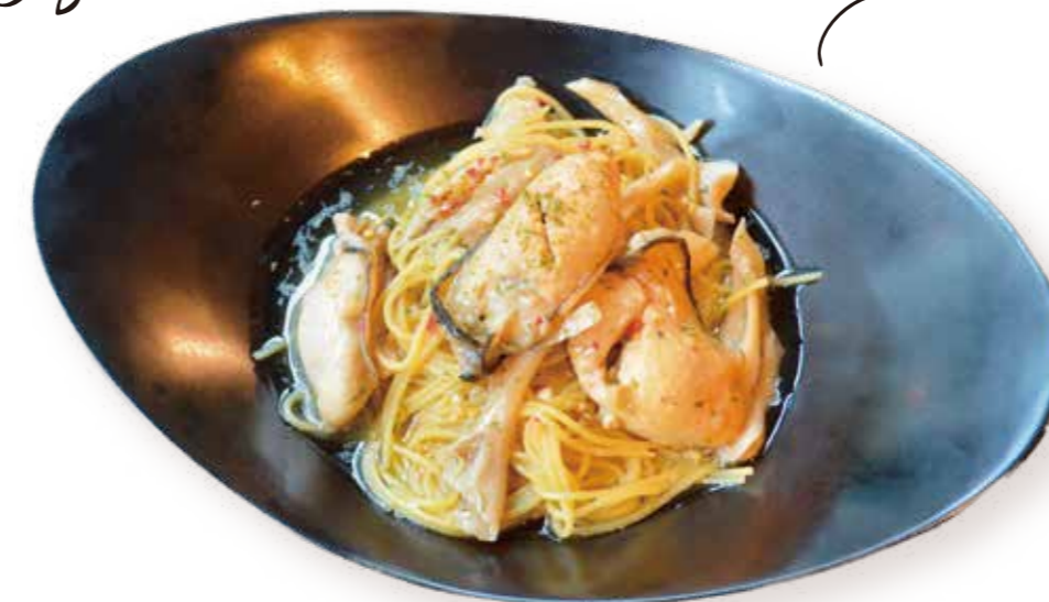
大粒牡蠣のペペロンチーノ Peperoncino with large oysters