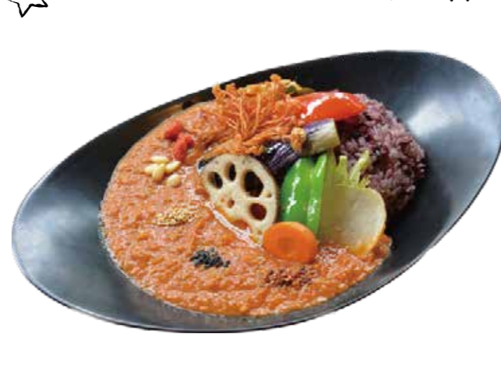
真野屋自家製の薬膳カレー Manoya homemade curry

真野屋の人気、薬膳カレーをパスタにかけちゃいました。初登場の焼きカレーパスタです！