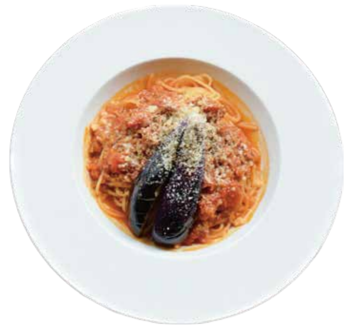
手作りミートソーススパゲッティーニ Meat Sauce Spaghetini