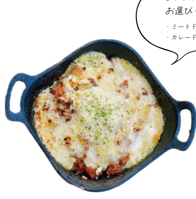
自家製ミートドリア・カレードリア Manoya's homemade doria