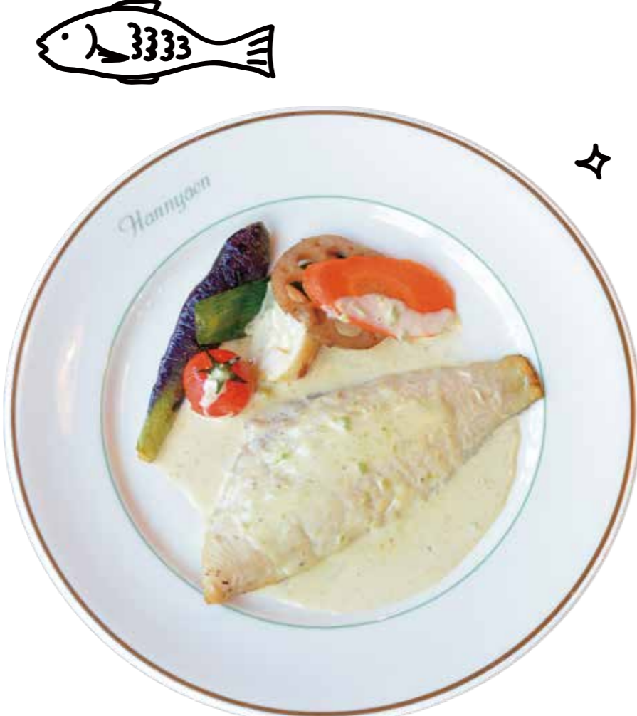
本日のお魚セット Today's fish set