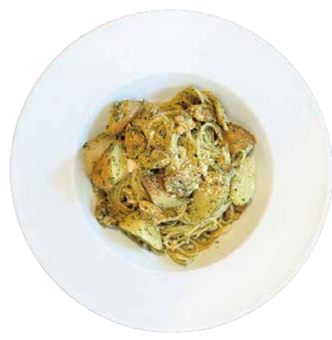
あさりとしゃがいのもの パセリジェノベーゼパスタ Clams and Potato with Parsley Genovese Pasta

ぷりぷり海老とキノコがトマトの酸味とクリームのコクでマッチする何度でも食べたくなるトマトクリームパスタです。