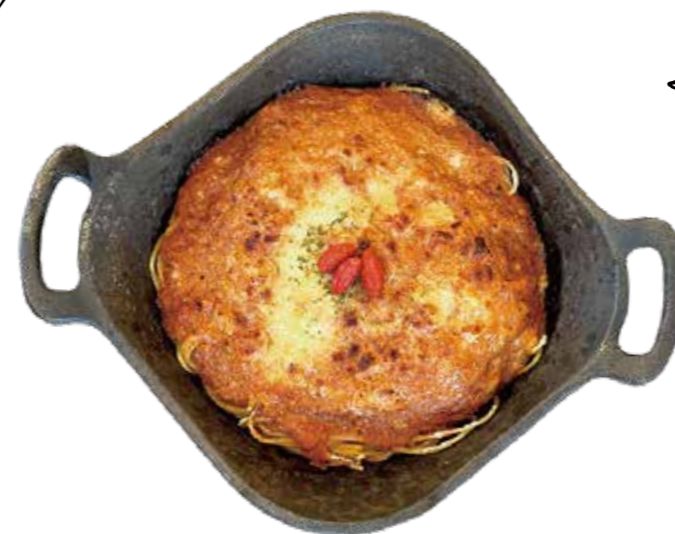
焼きカレーパスタ Baked Curry with Spaghetini