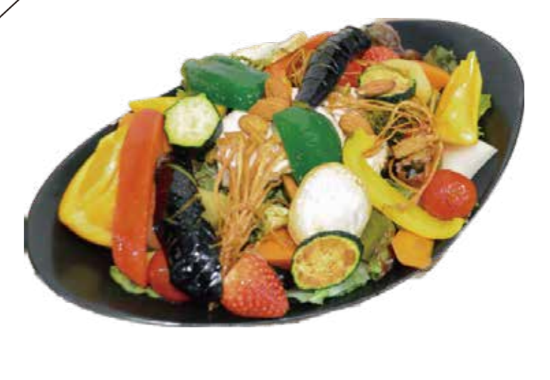
ボリューム満点パワーサラダ Power salad