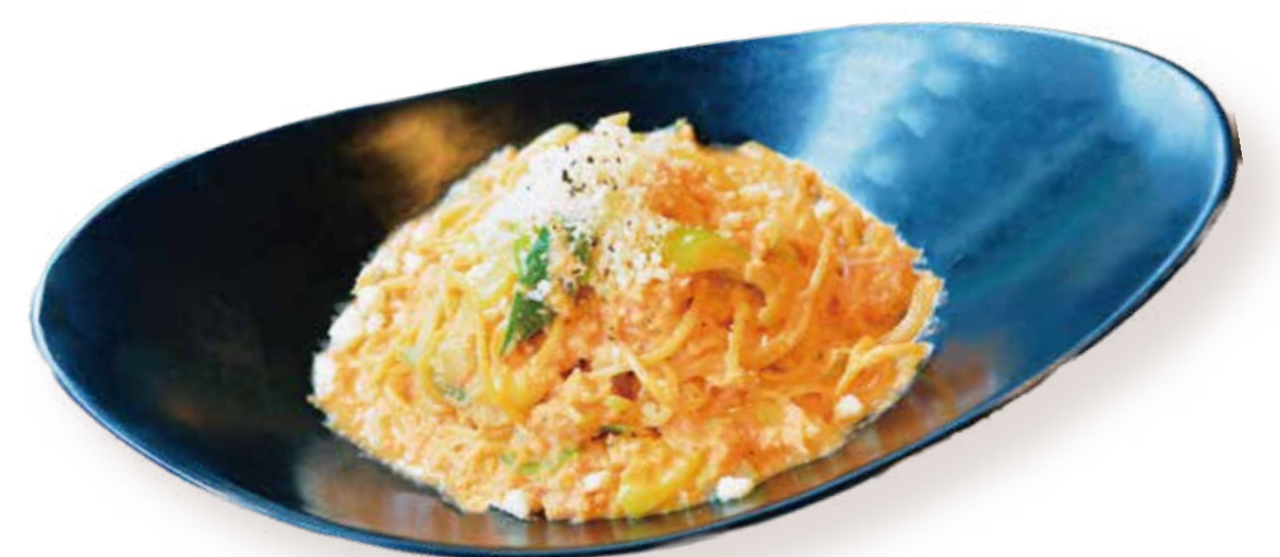
ズワイガニのビスククリームパスタ Bisque cream pasta with snow crab

大粒牡蠣の自家製ペペロンチーノです！牡蠣の旨みとピリッとした辛味がたまらない一品です！