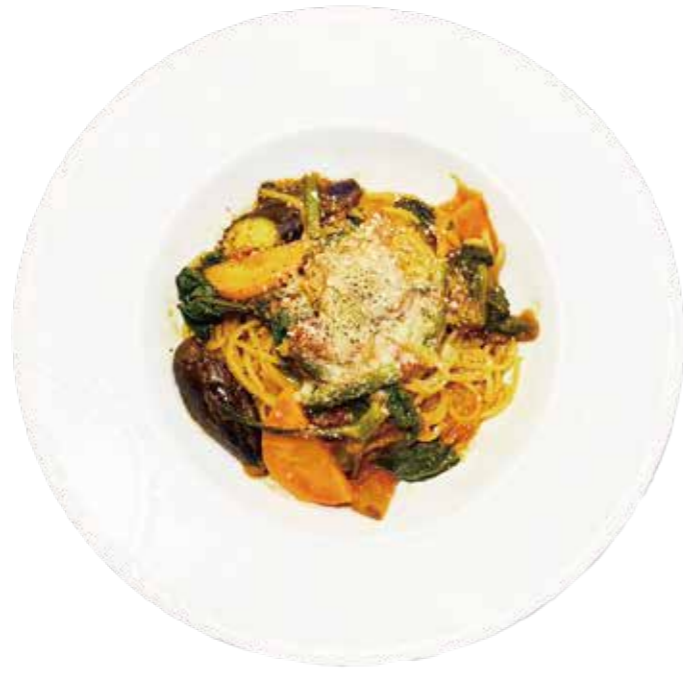
野菜たっぷりナポリタン Tomato Sauce with Vegetables