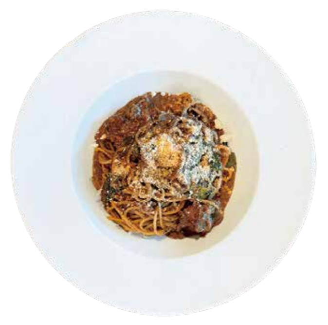
豚肉と野菜の黒ごま塩麹クリームパスタ Pork and Vegetables Pasta with Black Sesame SHIO-KOJI Cream Sauce