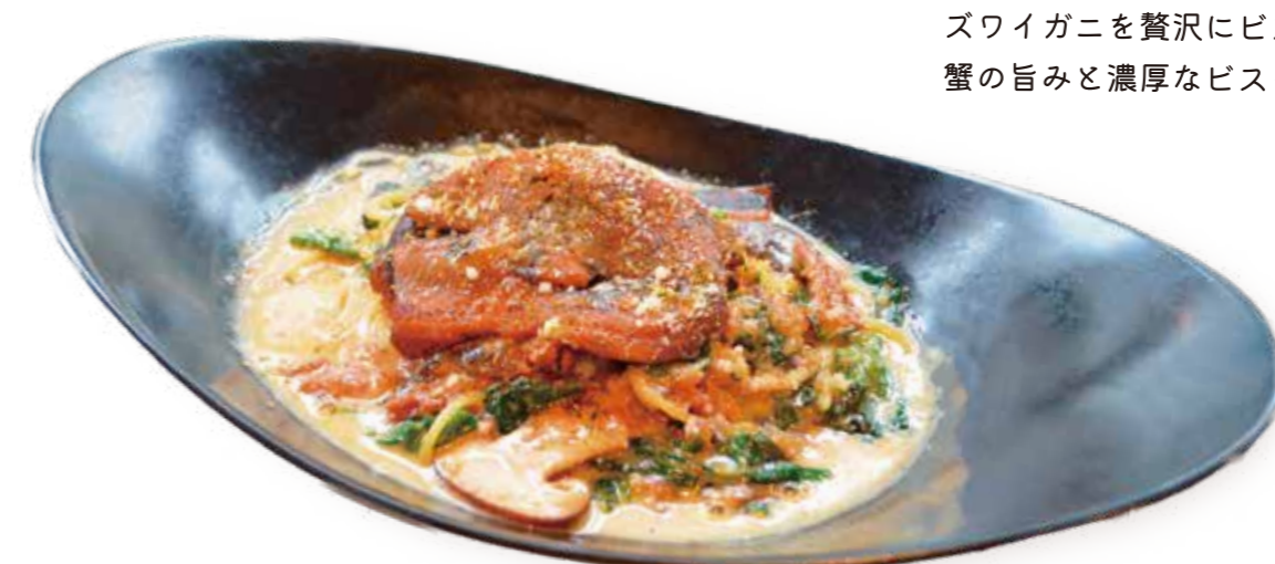
あなごのクリームパスタ Cream pasta with conger eel