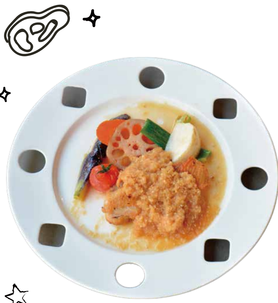
本日のお肉セット Today's meat set